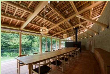
木材を活かした事例