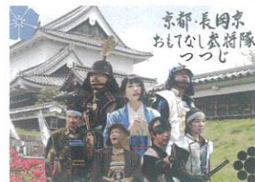
京都・長岡京 おもてなし武将隊 つつじ による長岡京市の歴史PRステージ