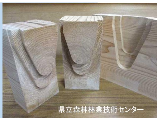
県立森林林業技術センター