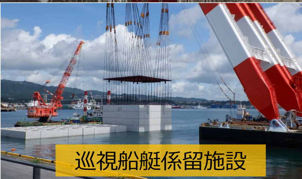
巡視船艇係留施設